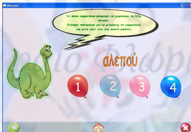
Εικόνα 2. Παιχνίδι Μετρώ τις συλλαβές από την ενότητα Αλεπού .

Μετρώ τις συλλαβές: Τα παιδιά ενθαρρύνονται να μετρήσουν τις συλλαβές των λέξεων χτυπώντας παλαμάκια. Πρόκειται για μια δραστηριότητα εύκολη για τα παιδιά νηπιαγωγείου, καθώς «η έννοια της συλλαβής αποτελεί προφέρσιμη, φυσική διαίρεση του φωνούμενου λόγου και η συλλαβική κατάτμηση ενέχει την έννοια του ρυθμού την οποία τα παιδιά γρήγορα κατανοούν και χαίρονται» (Παντελιάδου, όπως αναφ. στο Γιαννικοπούλου 2003) (Εικόνα 2).