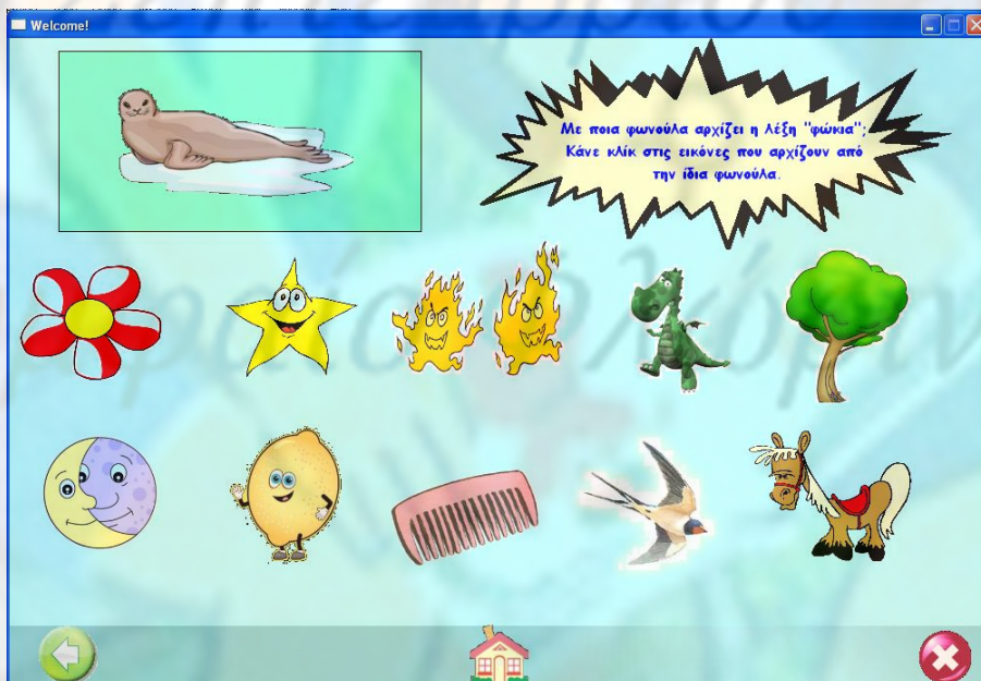
Εικόνα 3. Παιχνίδι Βρίσκω τα ζωάκια που το όνομά τους αρχίζει από την ίδια φωνούλα , από την ενότητα Φώκια .

Βρίσκω τα ζωάκια που το όνομά τους αρχίζει από την ίδια φωνούλα: Τα παιδιά παρατηρούν ποιες λέξεις αρχίζουν από το ίδιο φώνημα. Αποτελεί δηλαδή δραστηριότητα μεταφωνολογικής ενημερότητας για τις σχέσεις ήχου-συμβόλου, για την ανάγνωση (Κουτσουβάνου, 2006)). Στο πάνω μέρος της οθόνης εμφανίζεται το επιλεγμένο ζωάκι, ενώ στο κέντρο βρίσκονται 12 εικόνες. Το παιδί καλείται να επιλέξει τις εικόνες που απεικονίζουν ένα αντικείμενο το οποίο αρχίζει από το ίδιο φώνημα με το ζωάκι. Για να βοηθηθούν τα παιδιά, περνώντας το δείκτη του ποντικιού πάνω από το αντικείμενο ακούγεται το όνομά του, ενώ για γίνει η επιλογή του, πρέπει το παιδί να κάνει «κλικ» σε αυτό. Σε αυτή τη δραστηριότητα, όπως και στην παραπάνω, υπάρχει λεκτική ανατροφοδότηση, θετική και αρνητική («μπράβο τα κατάφερες», «προσπάθησε ξανά») (Εικόνα 3).