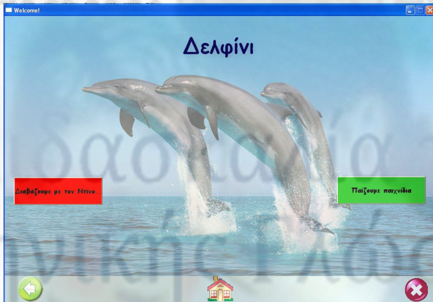
Εικόνα 5. Αρχική σελίδα της ενότητας Δελφίνοι .

Η πλοήγηση είναι μη γραμμική και ειδικά σχεδιασμένη, έτσι ώστε τα παιδιά του νηπιαγωγείου να μπορούν να χρησιμοποιήσουν το λογισμικό με ευκολία. Σε κάθε δραστηριότητα δίνονται και ηχητικές οδηγίες ή πληροφορίες. Όλα τα βασικά εικονίδια τοποθετήθηκαν σε σταθερό σημείο στο κάτω μέρος της οθόνης για να είναι ευδιάκριτα από τα παιδιά. Το μέγεθος τους είναι το μέγιστο δυνατό για να διευκολύνουν τα παιδιά στη χρήση. Σε κάθε οθόνη υπάρχει η δυνατότητα επιστροφής στην εισαγωγική σελίδα, εξόδου από το πρόγραμμα και επιστροφής στην αρχική οθόνη της ενότητας. Γενικά, τα παιδιά μπορούν να επιλέξουν τον τρόπο εξέλιξης του λογισμικού, έπειτα όμως από εξοικείωση με το περιβάλλον. Η παρουσία, ωστόσο, του εκπαιδευτικού θεωρείται απαραίτητη, αφού έχει ρόλο συμβουλευτικό και υποστηρικτικό.